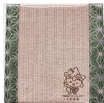
「くだまるミニ畳」 価格 825円(税込)