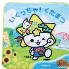
「くだまる」ミニタオル 価格 440円(税込)