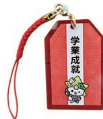
「お守り」 価格 550円(税込)