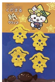
「くだまる紙クリップ」 価格 330円(税込)