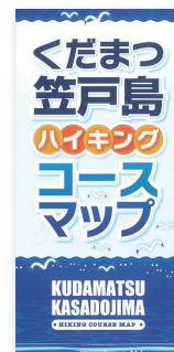
ハイキングコースマップ