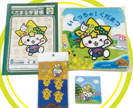
「くだまる」セット 価格 1,200円(税込)