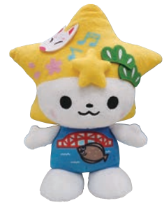
「ぬいぐるみ (20cm)」 価格 2,200円(税込)