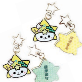
「お守り」 価格 各500円(税込)