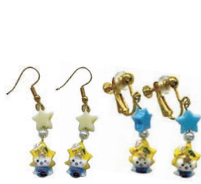
「くだまる」ピアス 「くだまる」イヤリング 価格 各660円(税込)