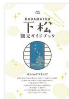
下松観光ガイドブック