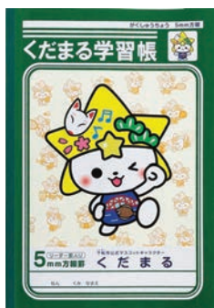
「くだまる」学習帳 価格 330円(税込)