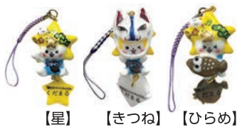
【星】 【きつね】 【ひらめ】 「くだまる」ストラップ 価格 各550円(税込)