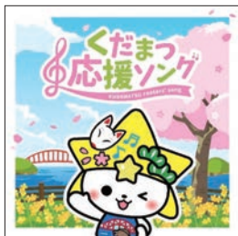
「くだまつ応援ソング」 価格 1,100円(税込)