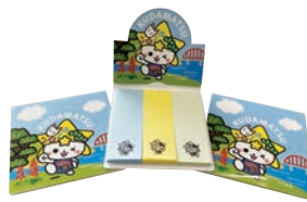
「くだまる」ふせん 価格 330円(税込)