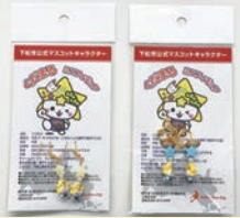
「くだまるイヤリング・ピアス」