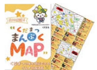
くだまつまんぶくMAP