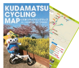
くだまつサイクリングMAP