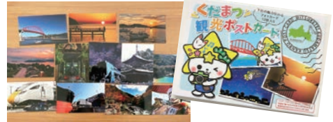
「くだまつ観光ポストカード (12 枚入) 価格 880 円 (税込)

令和3年9月～10月に募集した「魅つけて！くだまつフォトコンテスト」の受賞作品を含めたポストカードを販売開始しました。