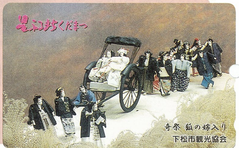
奇祭 狐の嫁入り 下松市観光協会