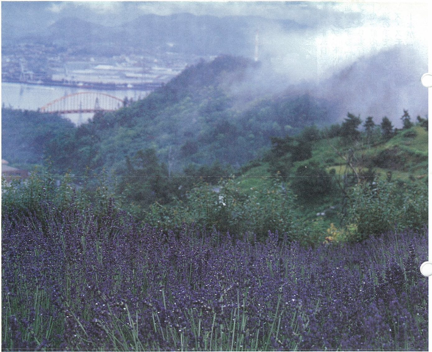
ラベンダー薫る笠戸島から市街を望む