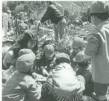
植樹をする保育園児

したところ、立派なアルミ製の記念プレートが用意されたことや、メンテナンスは笠戸島家族旅行村がお世話してくださること、又、マスコミ各社のご協力もあり、市内はもとより九州・関東方面からも申し込みが殺到、予定された二百本に対し、二百四十四本の植樹が決定しました。実行委員会は今さらながら、自然に対する人々の関心の高さに驚きました。