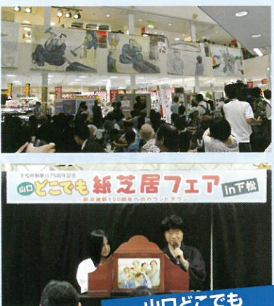
山口どこでも紙芝居フェア in 下松

きやら「ガーリックくん」も誕生し、5月の来巻にんにく収穫祭では、華陵高校舞台芸術部による「来巻にんにくの歌」とダンスを披露しました。他のイベントに「ガーリックくん」を呼んでもらうことも増え、少しずつ市民の方に認知してもらっているのではないかと思います。