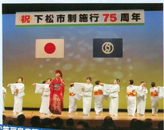
下松笠戸島音頭お披露目

さらに、下松市・下松市観光協会の委託を受け、制作に取り組んできた「下松笠戸島音頭」が完成し、11月2日に行われ