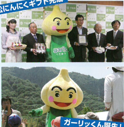
ガーリックくん誕生!