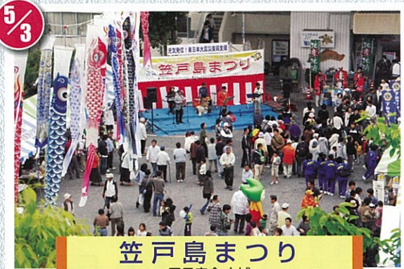
笠戸島まつり 国民宿舎大城