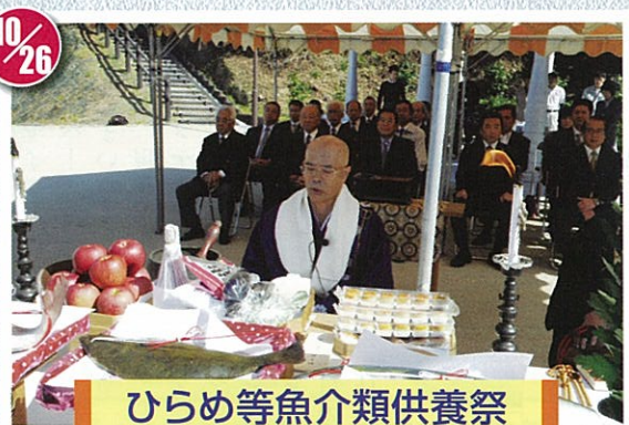
ひらめ等魚介類供養祭 はなぐり中間緑地公園