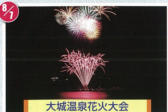
大城温泉花火大会 国民宿舎大城