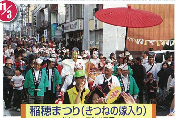
稲穂まつり(きつねの嫁入り) 法静寺~周防花岡駅