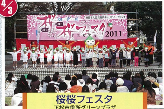
桜桜フェスタ 下松市役所グリーンプラザ