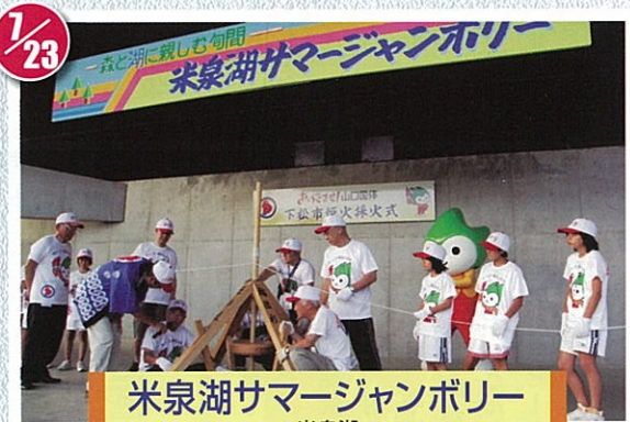
米泉湖サマージャンボリー 米泉湖