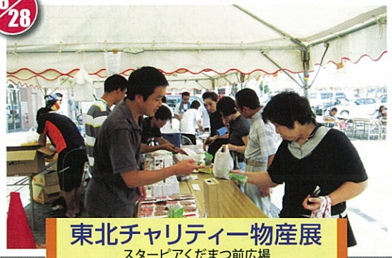
東北チャリティー物産展 スターピアくだまつ前広場