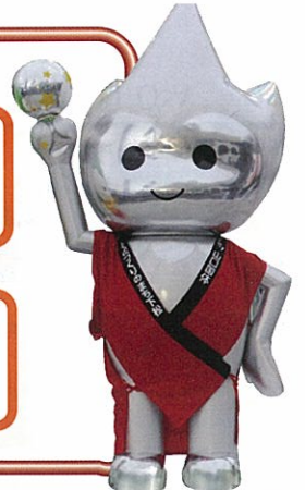
アルミ製ちよるる