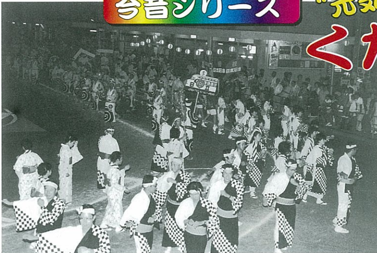
昭和 60 年の市民総おどり