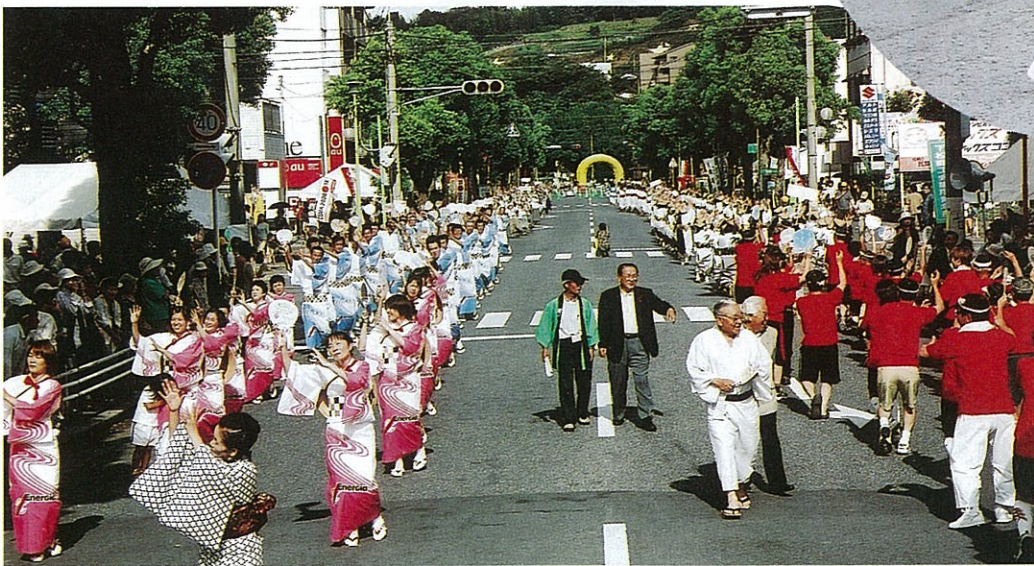
賑やかに復活した 市民総おどり

快進撃を続けていた衣料の量販店ユニクロの売上げが減少し、株価も下降しているという、破格の低価格でこの不況時代を席卷したあの勢いはどこに行つたのだろう。大量生産、大量消費、大量破棄の二十世紀型は大衆を画的な価値観でくくり、多くの人々が共鳴する事が一番という少し危うい日本人の民族性（ワールドカップで、にわかサッカーファン・サポーターが急増したような事項）とマッチして急成長してきたが、時代の変化と同業者の追い上げで苦戦を余儀なくされている。なにはともあれ山口県発の全国区の流通業のヒーローだから是非頑張つて欲しいものだ。 今IT時代といわれ地方にいながら世界の情報を手に入れる事ができるし、発信することもできる。しかしその情報通信にビジネス展開を加味する事は容易な事ではない。やはり何をやるにも人口の集中した大都市周辺には勝てないのだろう。地方の時代はいくら声高に叫んでも地域や個人の自立がないと始まらない。一人一人が二十一世紀型の地球環境をテーマにゆとり、健康、思いやり、創造性等をそれぞれの生活基盤の中でどうやって実践し、表現していくのか、個々の思いを確立する必要がある。