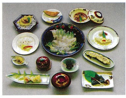
笠戸ひらめフルコース (姿造りは3人前)

割安料金でしっかりと量のある、ひらめの「夕映えプラン」、ふくの「幸ふくプラン」が大人気です。温泉が湧けば、今以上に多くの人が笠戸島を訪れる事でしょう。そのためにも良いサービスができるよう責任は重大です。