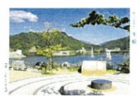
▲自然とふれあう米泉湖