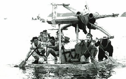
笠戸島にスターウォーズ出現！