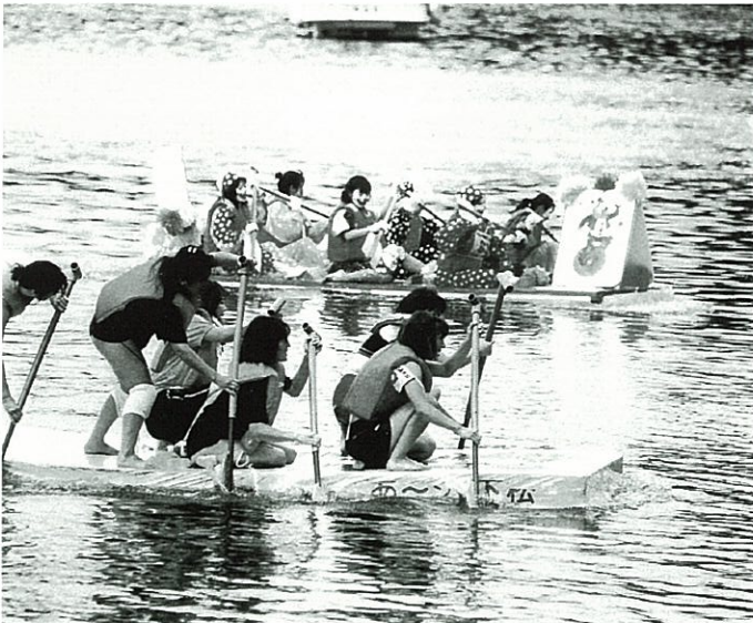
ゴール間近！女性部門の激しいトップ争い

今年も大会が無事運営できたことは各団体の方々に協力していただいたことです。また、OBや新入部員、現部員の団結と協力により事故なく無事終了することができました。 参加チームは昨年よりやや少なくなりましたが43艇の出場、観客も約三〇〇人以上とやはり下松市の夏のイベントとして定着していることを今更ながら強く感じました。 競技はパフォーマンズの参加が年々多くなりレースだけでなく、参加者のチームカラーを表現することが非常に上手になり、楽しい雰囲気を作り上げていました。また着岸した時のクルーたちは皆疲れきった表情でしたが、全員「さすががしい顔」をしていたことが印象深くのこりました。 最後の表彰式で「来年もまた参加します。」と言う声を聞いたときに初めてほっとした思いがしました。これからも下松市のイベントとして発展していくことを願っております。 皆様のご支援ご協力、誠にありがとうございました。