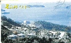
▲瀬戸内海国立公園 笠戸島