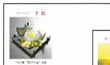
▲下松名物'笠戸ひらめ'料理