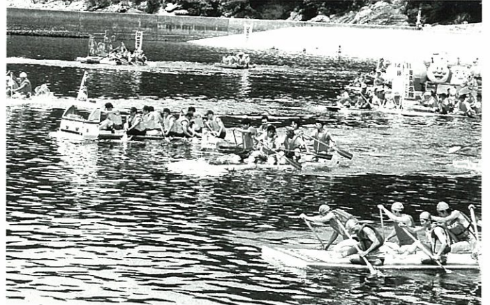
それいけ！スタートの合図とともに猛ダッシュ！

今年も大会が無事運営できたことは各団体の方々に協力していただいたことです。また、OBや新入部員、現部員の団結と協力により事故なく無事終了することができました。 参加チームは昨年よりやや少なくなりましたが43艇の出場、観客も約三〇〇人以上とやはり下松市の夏のイベントとして定着していることを今更ながら強く感じました。 競技はパフォーマンズの参加が年々多くなりレースだけでなく、参加者のチームカラーを表現することが非常に上手になり、楽しい雰囲気を作り上げていました。また着岸した時のクルーたちは皆疲れきった表情でしたが、全員「さすががしい顔」をしていたことが印象深くのこりました。 最後の表彰式で「来年もまた参加します。」と言う声を聞いたときに初めてほっとした思いがしました。これからも下松市のイベントとして発展していくことを願っております。 皆様のご支援ご協力、誠にありがとうございました。